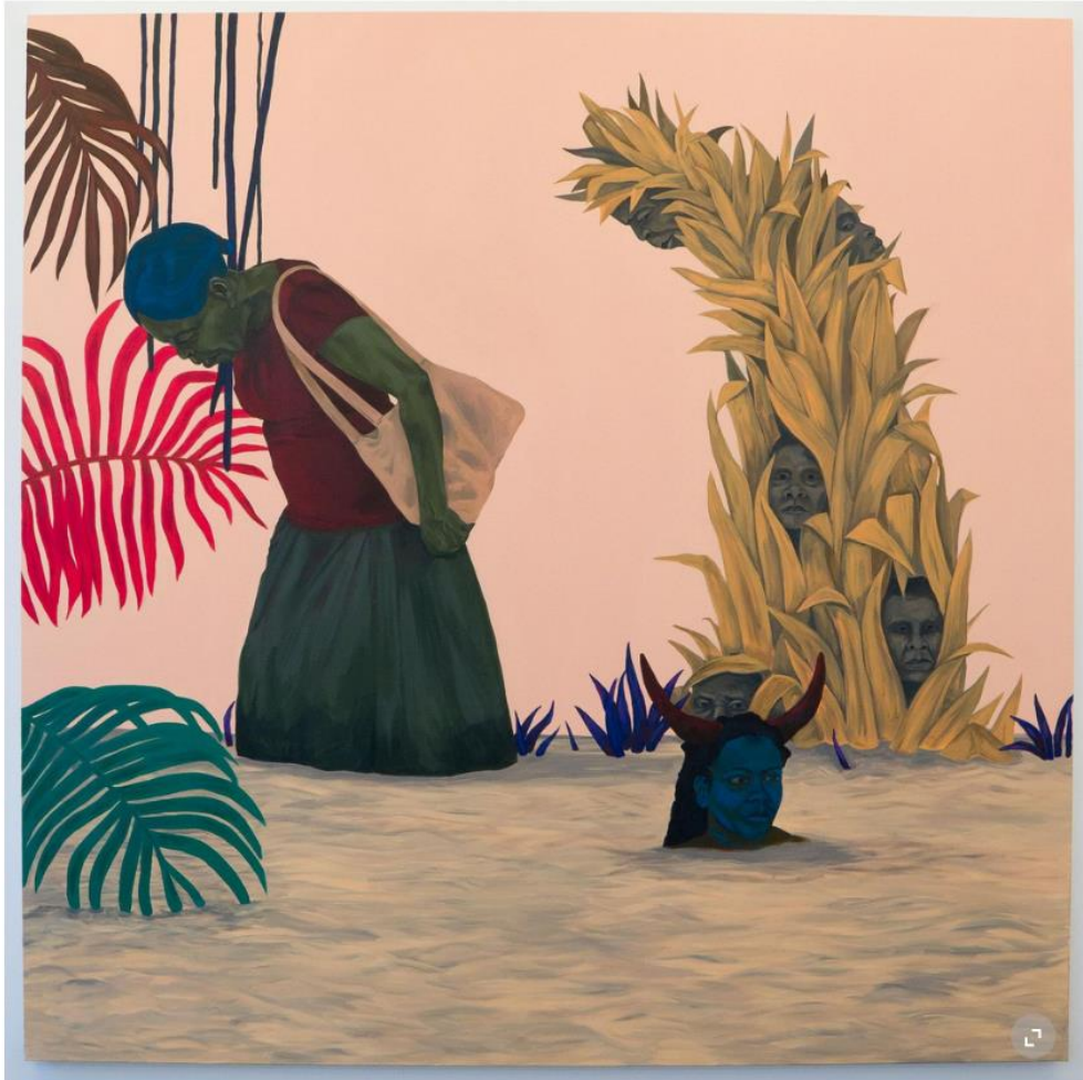
Tessa Mars: «A Vision of Peace, Harmony and Good Intelligence» (2020). © Caribbean Art Initiative

Der Vertrag entbehrte aber nicht einer für das Zeitalter des Kolonialismus untypischen Absurdität, weil er Land verteilte, das Spanien gar nicht mehr gehörte. Denn schon während der Französischen Revolution führte General Toussaint Louverture einen Sklavenaufstand an und führte Haiti in die Unabhängigkeit. Der Ausstellungstitel «One Month After Being Known in That Island» bezieht sich auf eine Passage im Friedensvertrag, in der postuliert wurde, dass die spanischen Truppen einen Monat nach dem 22. Juli 1795, dem Datum, an dem das Dokument unterzeichnet wurde, bereit seien, ihre Plätze, Häfen und Gebäude auf der Insel zu räumen und an die Truppen Frankreichs zu übergeben. Da die revolutionären Sklaven die Plätze, Häfen und Gebäude aber längst in Beschlag genommen hatten und die Truppen ihrer Majestät längst nicht mehr darüber verfügten, war der Vertrag nicht einmal mehr das Papier wert, auf dem er formuliert war.